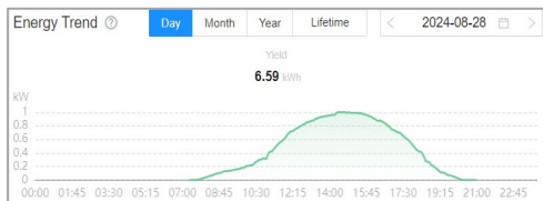
Curva de producción día medio

Evine Bodegas y viñedos Organic Wine Tecnología Vertical Monofacial